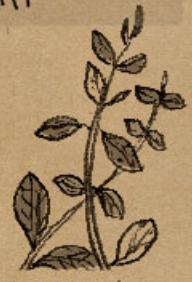
キョウチクトウ科 テイカカズラ属 ハツユキカズラ

幹がすべすべで木登り上手なサルも登れないことからついた名前。桃色の可愛い花がたわわに長く咲くので、漢字で「百日紅」とかく別名も