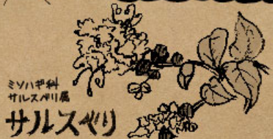
ミノハ早熟サルズヤリ属 サルズヤリ

幹がすべすべで木登り上手なサルも登れないことからついた名前。桃色の可愛い花がたわわに長く咲くので、漢字で「百日紅」とかく別名も