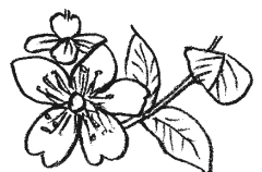
オトギリソウ科 オトギリソウ属