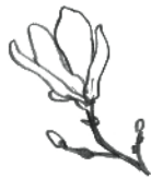
コブシ (モクレン科モクレン属)